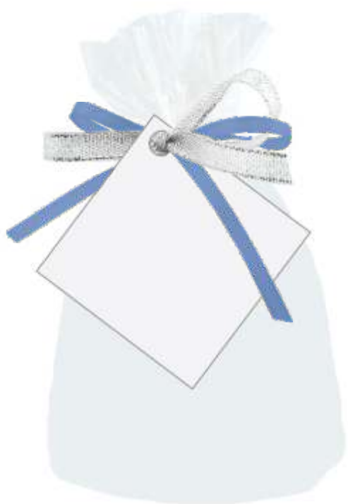
Бирка на свечи